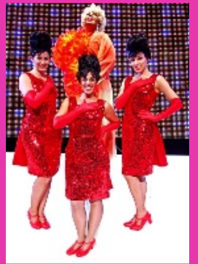
► Las Dinamita vivirán en carne propia el racismo.

La belleza interior es uno de los valores que se resaltan.