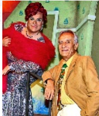
► La producción incluye vestuario colorido.

La belleza interior es un valor que se subraya a través de la historia de Tracy, personaje principal de la obra en la que también participan Hiromi, Marysol Sosa y Jorge Blanco.